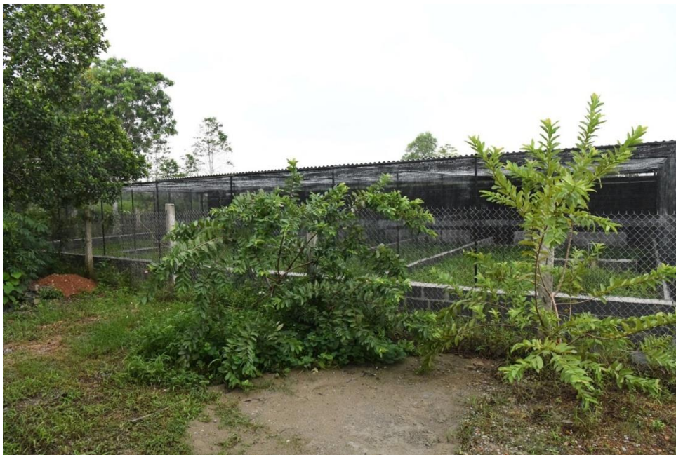
De nieuwe volières

Ter gelegenheid van het WPA symposium in Vietnam hadden de deelnemers ook de gelegenheid de nieuwe kweekvolières van VietNature te bezoeken.