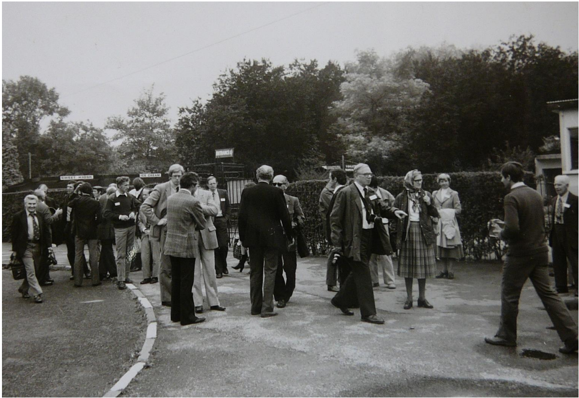
bezoek aan Chester Zoo