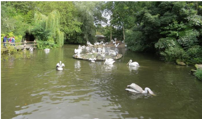
Een beperkte indruk van de aanwezige vogels