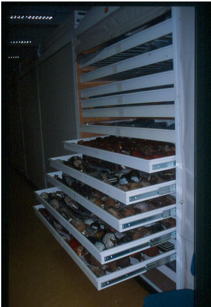
de collectie in het museum van Tring (UK)

Een belangrijk aspect van de laatste jaren is het oprichten en verder uitbouwen van een aantal Focusgroepen. De Focusgroep Wilde Kamhoenders, kreeg ruim 20 jaar geleden een nieuw elan als EJFG (European Junglefowl Focus Group) en verrichte baanbrekend werk door een vernieuwde wetenschappelijke aanpak. In plaats van de steeds maar opnieuw overgeschreven informatie uit de populaire fazantenboeken werd er naar de oorspronkelijke literatuur terug gegrepen. In musea werden balgen van in het wild verzamelde dieren bestudeerd en er werden DNA testen opgestart om de zuiverheid en onderlinge verwantschap van onze dieren te bepalen..