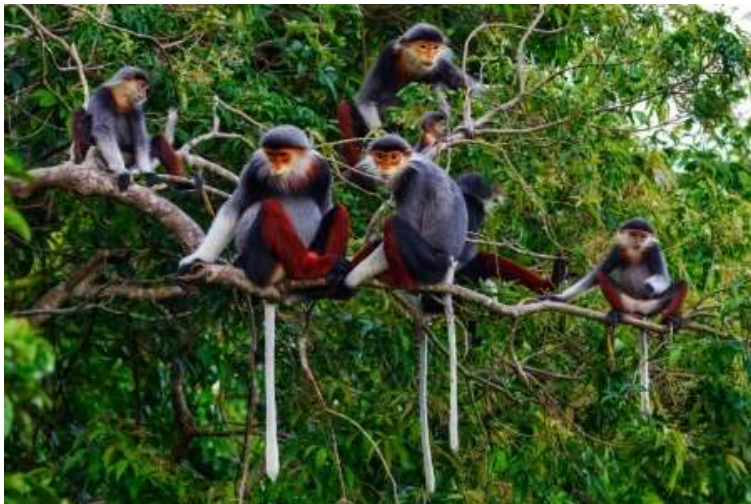
Roodscheendoek (Red-shanked Langurs) in het Khe Nuoc Trong Reservaat

Een bus tour door West Vietnam om de dierenwereld te zien. Laatste diner in Dong Hoi.