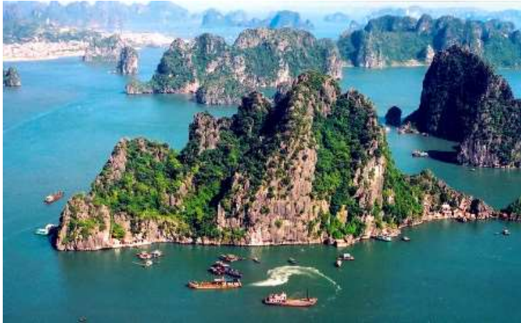
Bai Tu Long Baai, onderdeel van de beroemde Ha Long Baai