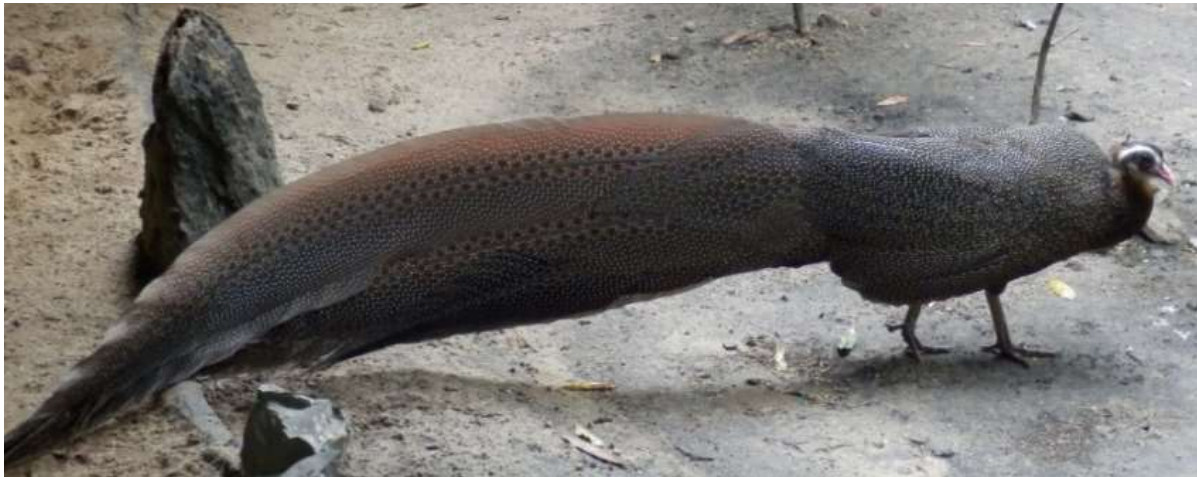
Gekuifde (Rheinardt) Argusfazant man in Saigon Zoo

Er bestaat ook de mogelijkheid langer te blijven, een hotel te boeken en Hoi Chi Minh Stad te verkennen.