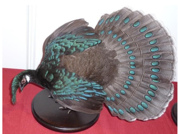
Blyth Tragopan – Borneo kuifloze vuurrugfazant– Witte oorfazant – Palawan pauwfazant