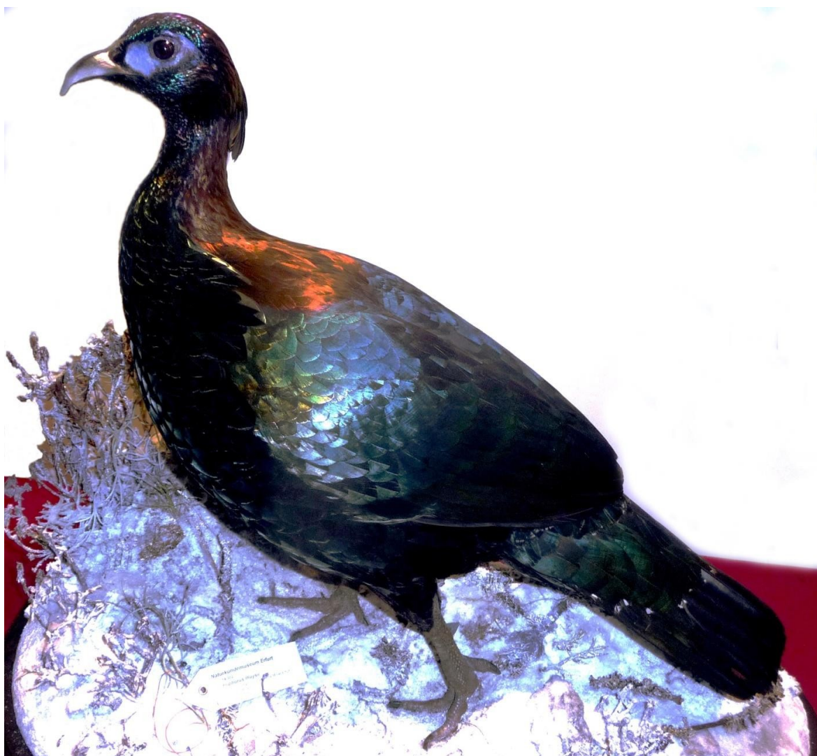
Chinese glansfazant - Lophophorus lhuysii