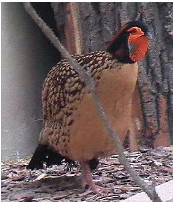
Cabottragopan in Beijing Zoo