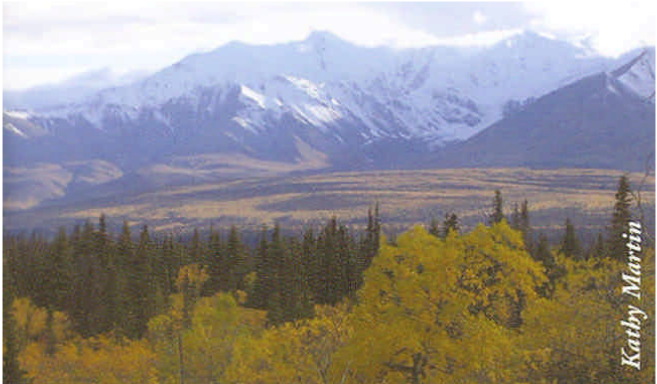
De Kluane regio, Zuid Yukon.