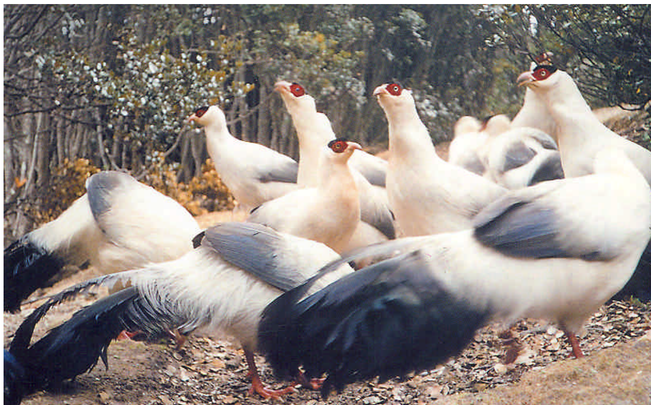
Groep Witte oorfazanten in West Sichuan ( Crossoptilon ssp crossoptylon ).