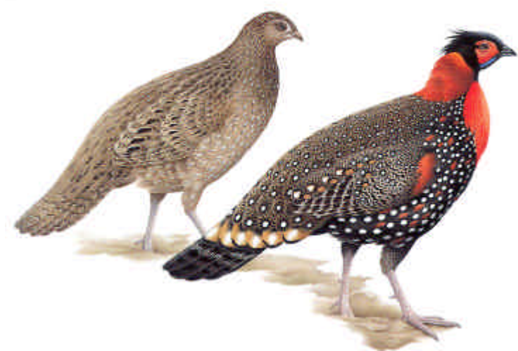
Tekening koppel Western Tragopanen

"Uiterste zorg wordt voor het onderhoud van de vogels genomen. Niemand wordt toegestaan de vogelopvang te bezoeken," zei een Wildlife-official.