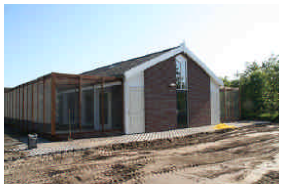
Voor Kant Fazanterie nog in aanbouw.

De eerste plaatjes zullen u vast nieuwsgierig maken hoe het resultaat wordt. Wellicht een mooie locatie voor een WPA-fazantendag in 2009.