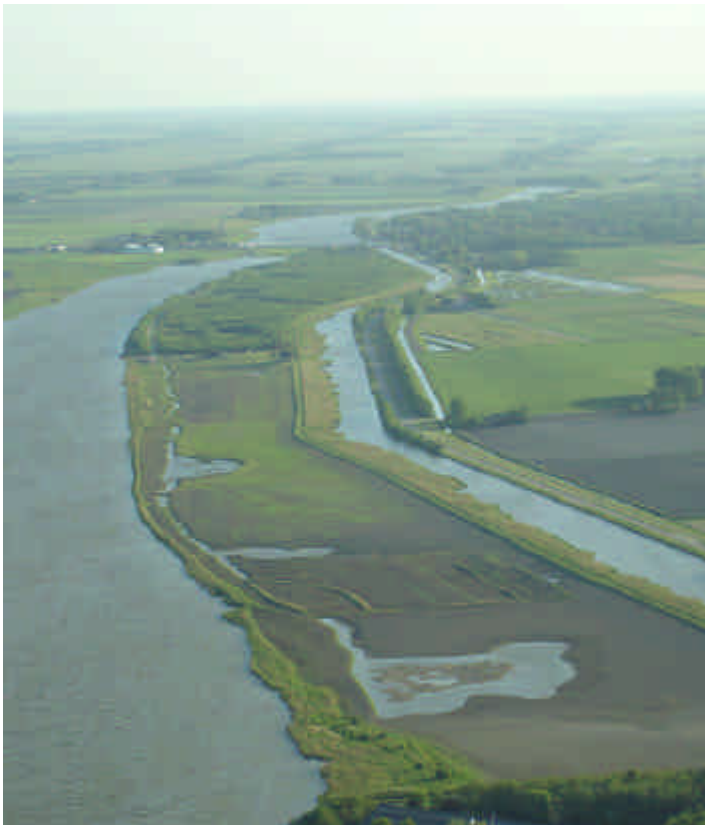
Een overzicht van het landgoed vanuit noordelijke richting.

Een ander deel is al geruime tijd bebost en daar wordt thans een diertuin met vooral veel uitheemse wilde vogels ingericht alsmede een kinderboerderij en verblijven voor nog andere wilde dieren. De daarvoor benodigde gebouwen zijn inmiddels gereed of nagenoeg gereed.