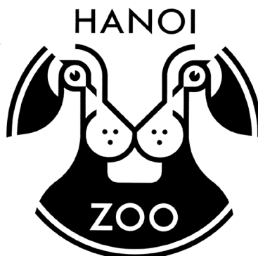
Logo Hanoi Zoo, gemaakt voor de World Pheasant Association's Indochina Programme. Ontwerp Maarten Vijgenboom Design, Venlo